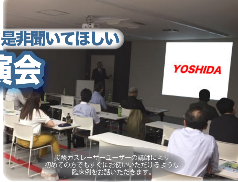
炭酸ガスレーザーユーザーの講師により初めての方でもすぐにお使いいただけるような臨床例をお話いたします。